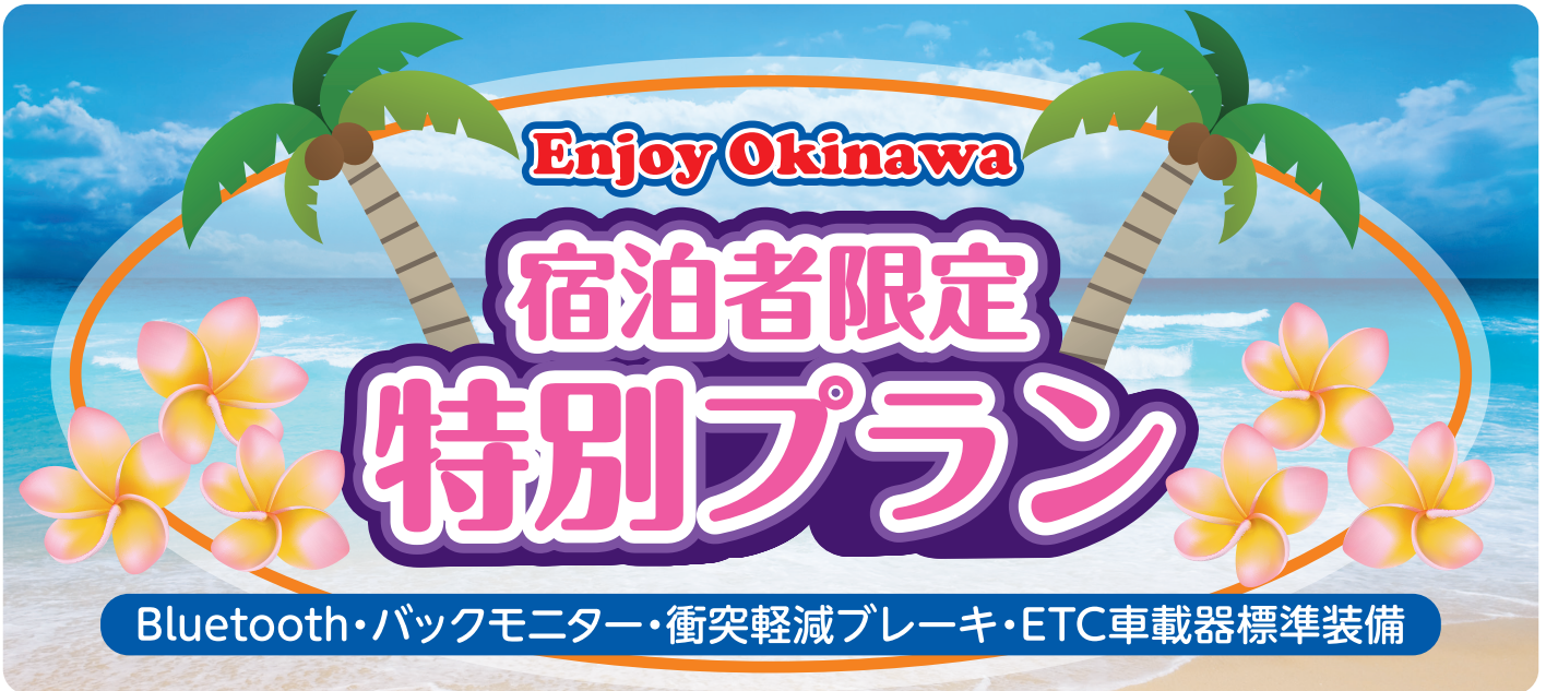
■ 宿泊者限定特別プラン料金表 ※基本レンタル料金・免責補償手数料・消費税を含みます。 単位：円（税込）